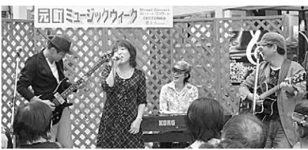
花キャラの演奏風景

化予算削減が言われる中、公的助成の充実と草の根の支援が求められています。「歩む会」についての問い合わせは足立世話人(六六五七四一七七五六)まで。 同楽団は一九七〇年創立。九三年から弁天町に練習場と事務所を置き、二〇〇三年にはNPO法人として再出発。年間百回を超す