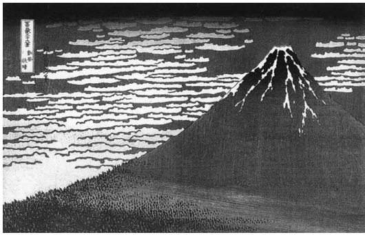
葛飾北斎「富嶽三十六景」から「凱風快晴」①と「山下白雨」②