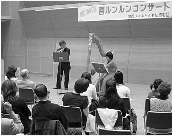
身近な演奏で地元楽団と市民が一体となった「関西フィルとともに歩む会11周年記念コンサート」=4月25日、弁天町オークホール

「凱風快晴」(別名「赤富士」)は夕立のこと。中腹から麓で吹く南風のこと。この図では富士山だけがクロソブアツプされ、近景も遠景もありません。ペロ(藍)ベルリンと雨天が競演する。実に夕靨の化学合成顔料の藍色(イナミックな構図です。もつ一つは「神奈川沖裏