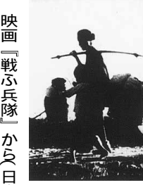
映画『戦ふ兵隊』から日本ドキュメントフィルム