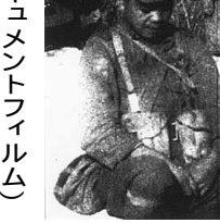
映画『戦ふ兵隊』から日本ドキュメントフィルム

戦争責任や被爆者追う不屈の精神は戦後も続く。『日本の悲劇』では戦争責任者を追及した。GHQは上映を許可したが時の吉田首相と平和、山本薩夫と共同 監督)の後、戦車や飛行機が東宝の労働争議を鎮圧した話は有名だ。暴力で文化は滅びない彼の言葉だ。『トリ・ムシ・サカナの子』は滅びない彼の言葉だ。『トリ・ムシ・サカナの子』は滅びない彼の言葉だ。『トリ・ムシ・サカナの子』は滅びない彼の言葉だ。