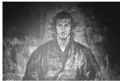
武蔵立像

宮本武蔵を主人公とした現在も執筆中の「バガボンド」をモチーフに、意外性と迫力に満ちた物語が百四十点に及び大小の肉筆画版(大阪版)。「バガボンド」「リアル」などの人気長編マンガを生み出した井上雄彦が、墨と筆で描き下ろした「空間マンガ」とも言える一編のストーリー