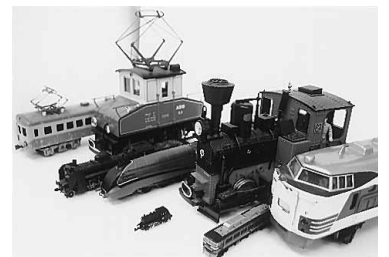
展示される鉄道模型

休なし。高校生以上四百円、四歳〜中学生百円。JR弁天町駅すぐ。六五八一〜一五七七。 港図書館 ①図書展示「子育て・親育ちの本」展 赤ちゃんとの付き合い方やお父さんの子育てなど、子育てのための情報や子育てを楽しむための知恵を収めた本を紹介。二月二十八日まで②「戦後昭和文庫」展 終戦後から昭和の終わりにまで記憶に残る出来事などについて書かれた本を紹介。三月三十一日まで③赤ちゃんのおたのしみ会 赤ちゃんと保護者対象。毎月第一金曜十一時から④おたのしみ会 幼児を対象に絵本の読み聞かせや紙芝居、手遊び、わらべ歌の紹介など。毎週水曜十五時半から。六五七六〜一三四六。