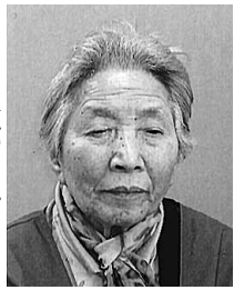
顔面に火傷を負っていた

(前号あらすじ) 旧天保町に生まれた私は結婚して二女を授かったが、家は強制撤去され夫は兵隊に。昭和二十年六月空襲で一歳四ヶ月の次女が焼夷弾で即死。私は避難した船底でB29が飛び去るのを待った。