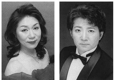
写真左。七月三十日(金)十九時からザ・シンフォニーホール(JR福島)で。一般三千円、学生千円、若手テノールデュオ「フエイズ」が日本の懐かしい歌を歌う。毎月一回金曜九時から(六月は二十五日)。会費千円(一飲物付)▽ガットネロは天王寺区上本町六(一三三)地下鉄谷町九丁目駅①出口、六〇九〇(四五六九)一六八〇七木藤。

から兵庫県立芸術文化センター(阪急西宮北口から南へ歩二分)で。一般三千円、学生千円、若手テノールデュオ「フエイズ」が日本の懐かしい歌を歌う。毎月一回金曜九時から(六月は二十五日)。会費千円(一飲物付)▽ガットネロは天王寺区上本町六(一三三)地下鉄谷町九丁目駅①出口、六〇九〇(四五六九)一六八〇七木藤。