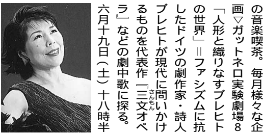
写真左。七月三十日(金)十九時からザ・シンフォニーホール(JR福島)で。一般三千円、学生千円、若手テノールデュオ「フエイズ」が日本の懐かしい歌を歌う。毎月一回金曜九時から(六月は二十五日)。会費千円(一飲物付)▽ガットネロは天王寺区上本町六(一三三)地下鉄谷町九丁目駅①出口、六〇九〇(四五六九)一六八〇七木藤。

から兵庫県立芸術文化センター(阪急西宮北口から南へ歩二分)で。一般三千円、学生千円、若手テノールデュオ「フエイズ」が日本の懐かしい歌を歌う。毎月一回金曜九時から(六月は二十五日)。会費千円(一飲物付)▽ガットネロは天王寺区上本町六(一三三)地下鉄谷町九丁目駅①出口、六〇九〇(四五六九)一六八〇七木藤。