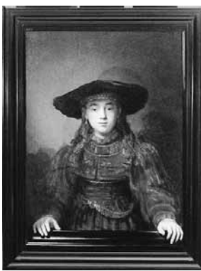
レンブラント・ファン・レイン「額縁の中の少女」1641年

●サントリーミュージアム「天保山」ギャラリー「ポランドの至宝」ポラも展示。十月六〜三十一日(会期中無休)。九時半〜四時。当日一般千二百円。地下鉄大港駅徒歩約五分。☎六五七七〇〇〇一。 ●交通科学博物館・京都大学鉄道研究会写真展「鉄道のある情景」生活の様々な場面を鉄道が占める位置を改めて振り返るような作品を展示する恒例の写真展。十月六〜三十一日(会期中無休)。九時半〜四時。当日一般千二百円。地下鉄大港駅徒歩約五分。☎六五七七〇〇〇一。