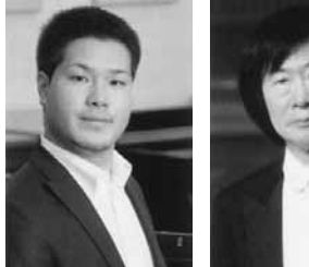
●関西フィルハーモニー管弦楽団「第224回定期演奏会」灼熱のメエストロ小林研一郎写真右がオルガン交響曲の壮麗な世界を指揮。ピアノはシヨパン生誕二百年を記念してロン

真展。六回目。今回は、駅をテーマに昭和三十年代から現在までの約六十点の写真を「方向転換」(鈴村国芳。九月二十六日まで)開催中(最終日十五時まで)。十一時入館、月曜休館(祝日なら開館)翌火曜休館(祝日なら振替なし)。