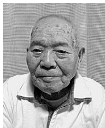
昭和二十年八月十五日、洞庭湖そばで玉音放送を聞き、敗戦を知りました。我々の部隊(高知の第四十師団)は中国軍(国民政府軍)に武装解除され、安慶の捕虜収容所に入れられました。

(前号まで)昭和十五年、二十歳で陸軍に入隊した私は中国へ渡り、江南作戦に参加。十七年の白兵戦では戦友を亡くし、十九年の桂林戦では満身創痍の身で学徒兵の最期を看取った