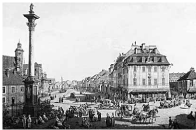
ベルナルド・ベロツト「ジグムント3世の円柱から見たクラクフ郊外通り」1767-1768年。ワルシャワ王宮所蔵。

宮や旧都クラクフのヴァウエル城に伝わる絵画工芸彫刻をはじめ、二つの国立美術館のコレクションから十九世紀ポーランド絵画も展示。レンブラントのモナリザと呼ばれる顔縁道画を一堂に写真イメ