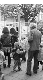
「民間委託」問題などで保護者会が奮闘している田中保育所(写真は朝の「お預け」風景)

LEDで海の時空館ライトアップ 「海の時空館」(住之江区)のライトアップに前田機械(株)市岡元町が取り扱うLED投光機八台が採用され、昨年十一月二十六日の夜間に点灯された。ライトアップはその成果の一つ。LEDには①消費電力が一般蛍光灯の約半分、②鉛や水銀を使わず地球に優しい③四万時間の長寿命④交換時の取り換え工事不要などの利点がある。