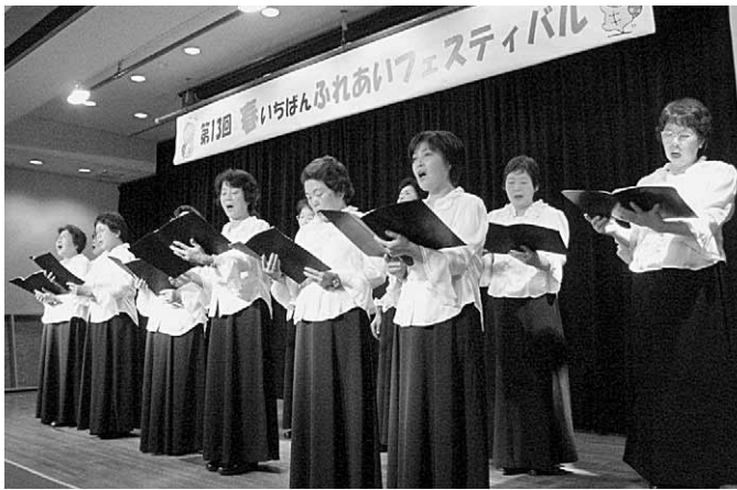
生涯学習の「花」が咲き競った「春いちばんふれあいフェスティバル」(写真は清らかな歌声が「春」を感じさせた三先小学校生涯学習ルームのコーラス)

春の訪れを前に、生涯学習の「花」が一足早く咲き競いました。二月二十七日、弁天町市民学習センターで開催された「春いちばんふれあいフェスティバル」では区内十一小学校の生涯学習ルームが一年間の成果を発表し、学びへの意欲を刺激しました。実行委員会と港区生涯学習推進員連絡会が主催、十三回目を舞台発表や作品展示ムを中心に、福祉施設なども加わり、歌や民謡、琴演奏、健康体操、太極拳、気功、詩吟などが次々と登場