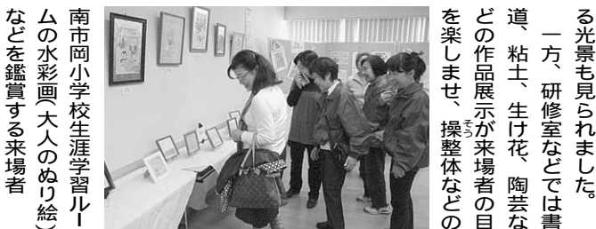
南市岡小学校生涯学習ルームの水彩画(大人のぬり絵)などを鑑賞する来場者

春の訪れを前に、生涯学習の「花」が一足早く咲き競いました。二月二十七日、弁天町市民学習センターで開催された「春いちばんふれあいフェスティバル」では区内十一小学校の生涯学習ルームが一年間の成果を発表し、学びへの意欲を刺激しました。実行委員会と港区生涯学習推進員連絡会が主催、十三回目を舞台発表や作品展示ムを中心に、福祉施設なども加わり、歌や民謡、琴演奏、健康体操、太極拳、気功、詩吟などが次々と登場