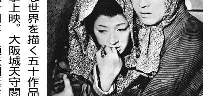
大阪物語「忘れじの人」

本興行の地域活性化イベントの一環。入場無料。第六回は六月二十六日(日)十四時から田中機械ホール(南市岡三二六)で。六五八三―〇三二六 近藤(ふとん館ひらのや)。喫茶&ギャラリーハハハ 月替わりで季節感溢れる企画。六月は毎年恒例「築光キャンドルナイト」 関連企画 七月半 十八時