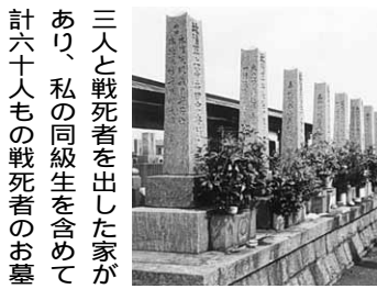
三人と戦死者を出した家があり、私の同級生を含めて計六十人もの戦死者のお墓が並んでいます。写真は、私と兄が大好きだった飛行機に乗って会いに来た飛行機に乗ったとき、若くて不安定なことが、若い人たちが我慢強くなってきたことが気になります。 戦後も六十六年が経ちますが、雨の日も風の日も、これは生きていく限り続けたいと思っています。(終わり)