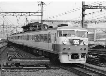
「よみがえる あの時代」 大阪環状線・大阪市電 勢電鉄・阪急電車などの過去と現在を比較する形で約二十点！写真は「大阪駅に進入する157系ひびき」

交通科学博物館 ①日本縦断！新幹線！その魅力を探る！一月九日まで開催 二十点！写真は「大阪駅に進入する157系ひびき」 日本の新幹線、その種類（昭和三十四年）▽十七歴史施設・設備人などを模写・映像・写真などで紹介②みなと消防フェスタ 十一月十九日（土）十時～十六時。はしご車や起震車の体験あり。港消防署共催③関西大学鉄道研究会写真展