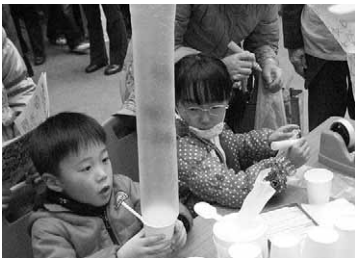
「竹の龍づくり」に夢中の兄妹