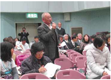
学校選択制と中学校給食について賛否両論が交わされた「港区学校教育フォーラム」(写真上は説明者、下は会場) 3月22日夜、港区民センターで

り、大差はない(市教委)。「選択制には期待しているが、大差がなく横並びになるのなら意味がないのでは(女性)」「基本的な教育内容は保障された上で、クラブ活動などでの特色はありうるし、あった方がよい。横並びになるといいことではない(市教委)」「地域と学校の関係も「選択制は地域の子どもの繋がりを壊す。それより一学級の人数を減らして教育の質を高めてほしい(女性)」市長は保護者の選択権を重視しているが、今のような意見もある。こうした議論を踏まえて考えていきたい(区長)」